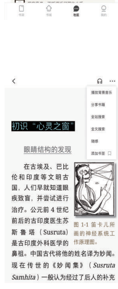
掌阅精选数字图书馆功能展示(部分)