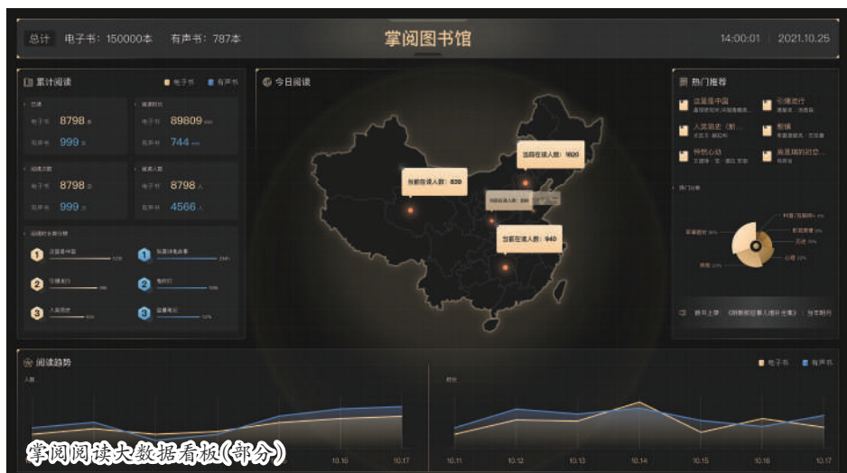
掌阅阅读大数据看板(部分)