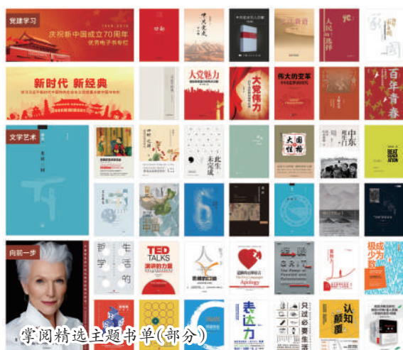
掌阅精选主题书单(部分)

国专利优秀奖,并荣获“国家知识产权优势企业”“北京市知识产权示范单位”等奖项。领先的专利技术是提供品质阅读体验的有力保障,是帮助使用者提升阅读兴趣和效率的坚实基础。书屋支持AI智能语音朗读、3D仿真翻页、背景音乐播放、阅读分享点赞、内容划线批注,以及搜索、评论、随感、笔记一键导出,自动生成阅读报告等功能,为使用者提供高效智能的阅读体验;支持在线制订个人及团队阅读计划目标、进行学习跟踪等功能,协助用户进行有目的性的阅读;支持IM即时通信,无需跳转即可自建或加入读书群,方便用户之间联络沟通;打造阅读社区,方便使用者随时随地学习、交流所思所想。