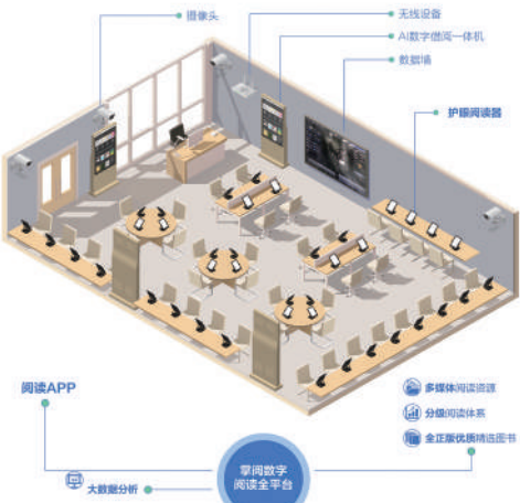
掌阅数字阅读全平台智能软硬件分解示意图