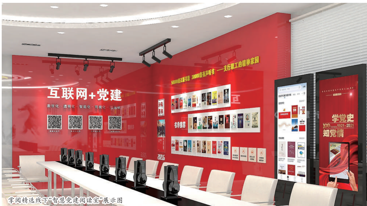
掌阅精选线下“智慧党建阅览室”展示图

智能高效体验,打造“智慧书屋”。 掌阅科技在数字阅读领域拥有专利技术近500项,曾获得第二十二届中