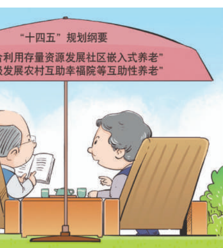
养老措施 新华社发 勾建山 作

通过问卷调查和实地调研，委员们对加快推进社会适老化改造工作逐步形成了一些共识性的意见和建议，他们表示，通过参与专项民主监督工作，深入了解了党的十八大以来我国社会适老化改造的整体情况，深刻认识到加强民主监督、加快推进社会适老化改造工作的重要性、紧迫性，对进一步落实好党中央决策部署具有重