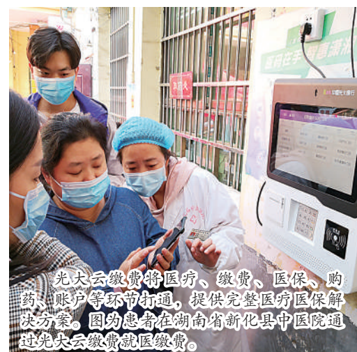
光大云缴费将医疗、缴费、医保、购药、账户等环节打通，提供完整就医医保解决方案。图为患者在湖南省新化县中医院通过光大云缴费就医缴费。

费积极发挥线上便捷服务优势，连夜加急上线水、电、燃气、医疗挂号、车辆临时号牌等缴费服务。云缴费App紧急同步上线天津、西安、绍兴、山西、大连、河北、江苏等疫情突