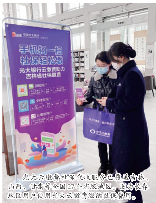
光大云缴费社保代收服务已覆盖吉林、山西、甘肃等全国27个省级地区，图为长春地区用户使用光大云缴费缴纳社保费用。

动县域“云上”民生工程，通过加速居民生活、便民政务、交通出行、医疗养老、便民金融服务等关键领域和生活场景的线上线下融合，促进城乡便民服务均衡发展。《2021年中国便民缴费产业报告》研究表明，数字便民缴费在偏远欠发达地区发展较快。从2018年开始，缴费行为在东、中、西部地区进一步均衡发展，线上化率明显提升。