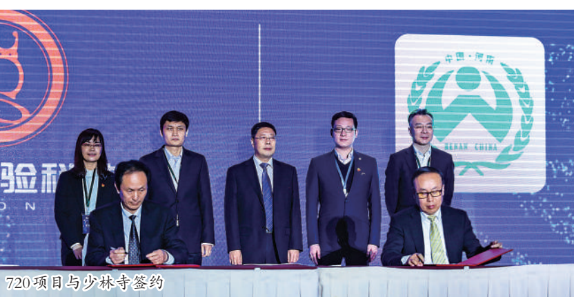
720项目与少林寺签约

720 穿越飞船主要是由胶囊型屏幕、720全景声系统和飞行平台（飞船）组成，之所以叫飞船，是因为观众坐在飞行平台上，感觉就像坐在飞船里在影片场景中穿行，体验刺激震撼，感觉愉悦欢乐，突破了观众只是观看的局限，真正将观众置身于影片场景中。