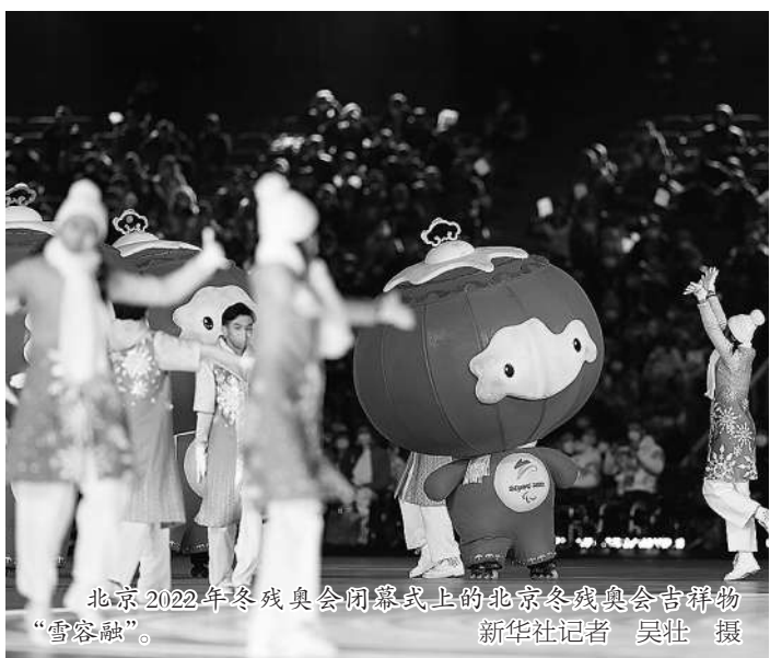
北京2022年冬残奥会闭幕式上的北京冬残奥会吉祥物“雪容融”。