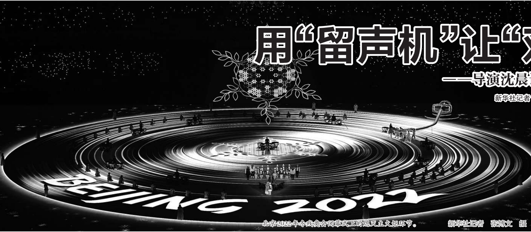
北京2022年冬残奥会闭幕式上的奥运五火火炬环节。