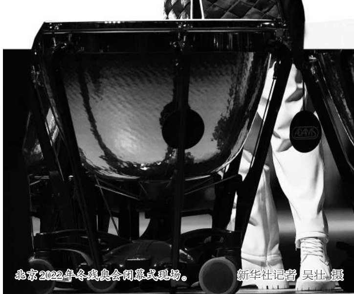
北京2022年冬残奥会闭幕式现场。