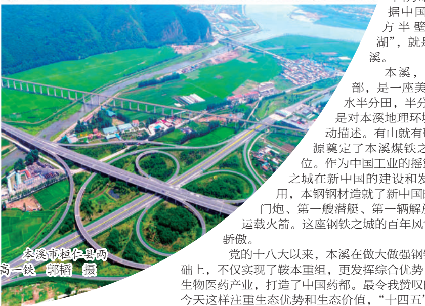
本溪市桓仁县两高一铁