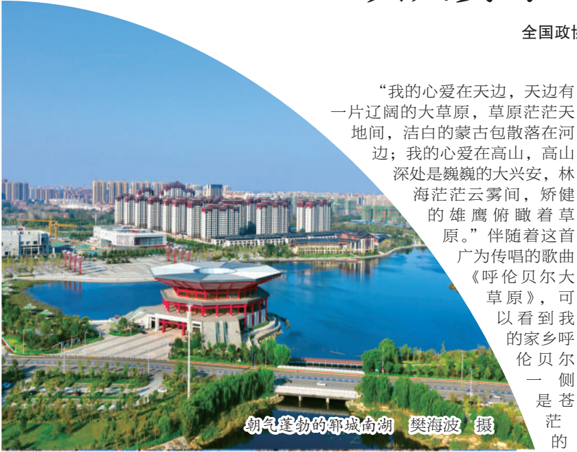
朝气蓬勃的郛城南湖

胡和平要求各地文化和旅游行政部门落实科学防控、精准防控要求,从严从实推进疫情防控工作。要围绕重点地区、重点领域、关键环节,全力做好A级旅游景区、旅行社和在线旅游企业、文化和旅游行业室内场所等疫情防控以及从业人员的健康监测和管理工作。同时,要加强应急处置,完善跨部门的沟通协调机制,强化联防联控,形成工作合力。要加强宣传引导,通过多种形式开展疫情防控知识宣传,引导广大人民群众严格遵守疫情防控规定。