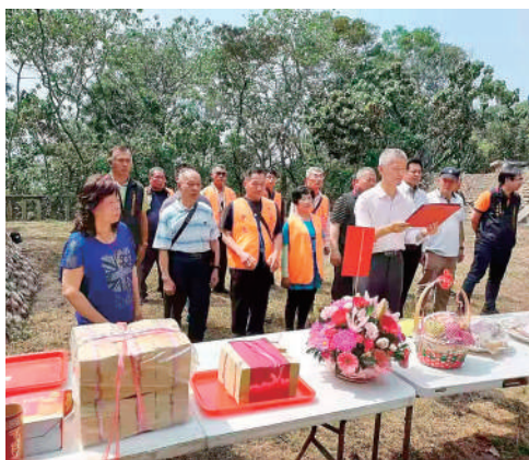
3月20日，来自台湾高雄、嘉义、彰化等地的颜氏宗亲，来到台湾嘉义县水上乡三界埔颜思齐墓前祭拜。

2021年，纪念颜思齐开台400周年系列活动在台湾各地陆续展开，拍摄历史现场短片、筹划观光主题活动、巡演颜思齐音乐舞台剧等。而在大陆，颜思齐事迹被正式写入国家历史教科书，让两岸共同的历史记忆更加清晰深刻，进一步揭示了中国人最早经营开发台湾的历史事实，再一次彰显台湾隶属于中国的法理依据，有助于明了颜思齐开发台湾与郑成功收复台湾之间的历史逻辑关系。2022年3月，厦门海沧区颜氏宗祠“廉政文化”家风家训馆成立，将先贤生动的家家训故事作为馆