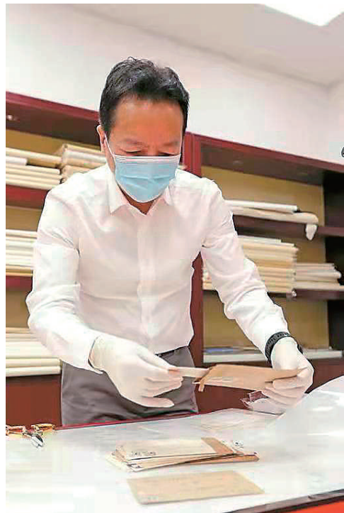
2019年5月闽台缘博物馆启动“征集海峡两岸往来书信”活动以来，收集到“两岸家书”1940余件。

入选世界记忆名录。目前，“侨批”保护与利用也已正式立法，《福建省“侨批”档案保护与利用办法》已于2021年12月1日施行。在江尔雄看来，从文献角度看，“两岸家书”的意义也不亚于“侨批”文献价值。