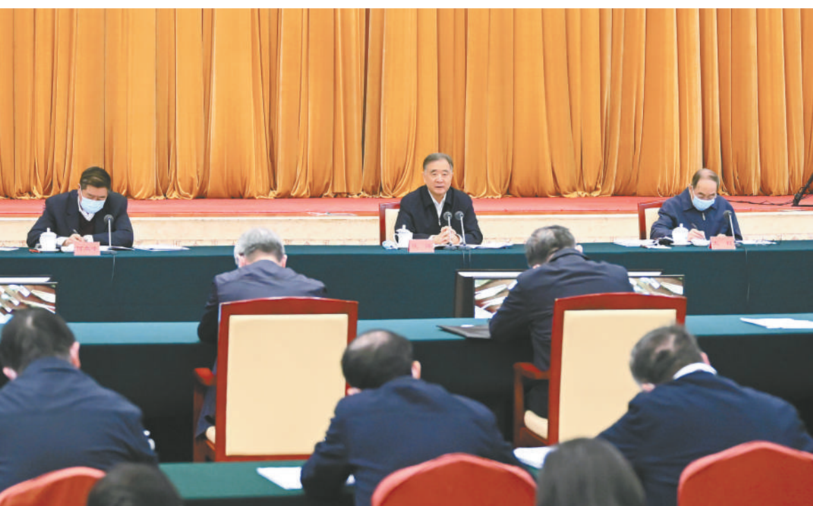
京四月一日，长江生态环境保护民主监督工作座谈会在北京召开。中共中央政治局常委、全国政协主席汪洋出席会议并讲话。

本报讯（记者 孙金诚）长江生态环境保护民主监督工作座谈会4月1日在京召开。中共中央政治局常委、全国政协主席汪洋出席会议并讲话。