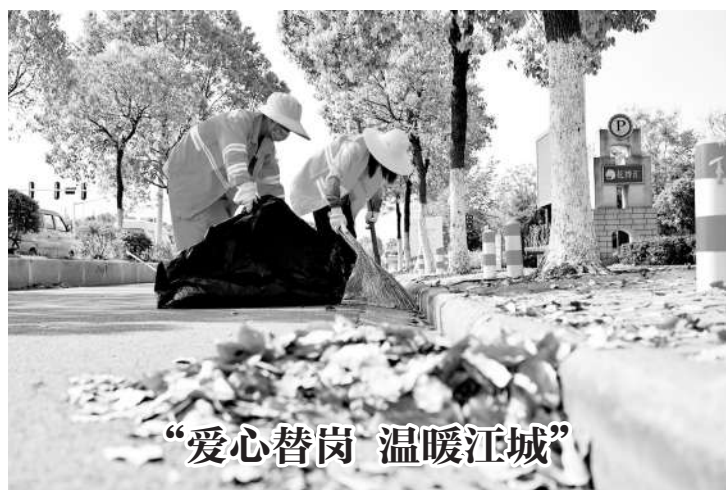
“爱心替岗 温暖江城”

爱服务，是提升农村群众健康素养，助推乡村振兴和提高农村群众幸福感、安全感的关键一环。据悉，除口腔护理和卫生护理等物资帮扶外，此次活动还将围绕女性生理特点，为云南省丽江市周边乡镇及河南省郑州市、安阳市等地的困境妇女开办公益课堂，发放女性卫生健康手册，进一步提高农村妇女健康安全意识，远离不良生活习惯，提升家庭生活品质。