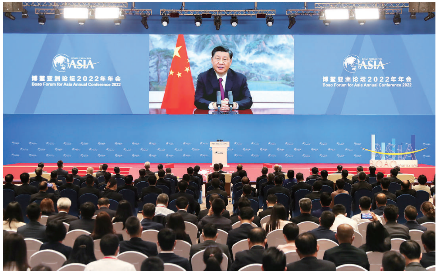
4月21日上午，博鳌亚洲论坛2022年年会开幕式在海南博鳌举行，国家主席习近平以视频方式发表题为《携手迎接挑战，合作开创未来》的主旨演讲。

新华社北京4月21日电 博鳌亚洲论坛2022年年会开幕式21日上午在海南博鳌举行，国家主席习近平以视频方式发表题为《携手迎接挑战，合作开创未来》的主旨演讲。