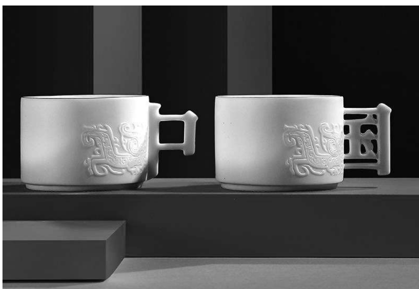
国博文化创意产品