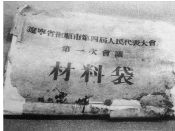
▲雷锋出席抚顺市第四届人民代表大会第一次会议用过的材料袋

雷锋住在宾馆二楼。他隔壁的两个房间，住有6位代表，都是六七十岁的老大娘。雷锋对这些老人十分尊重。8月6日的日记中，他写道：“我看见有6位六七十岁的老太太来参加抚顺市第四届人民代表大会，内心十分羡慕和尊敬。我看到她们就好像看到了自己的祖母一样。拉着她们的手，微笑着向她们问好，并把她们一个个送到宿舍，给她们倒茶、打水……并和她们有趣地拉家常。”