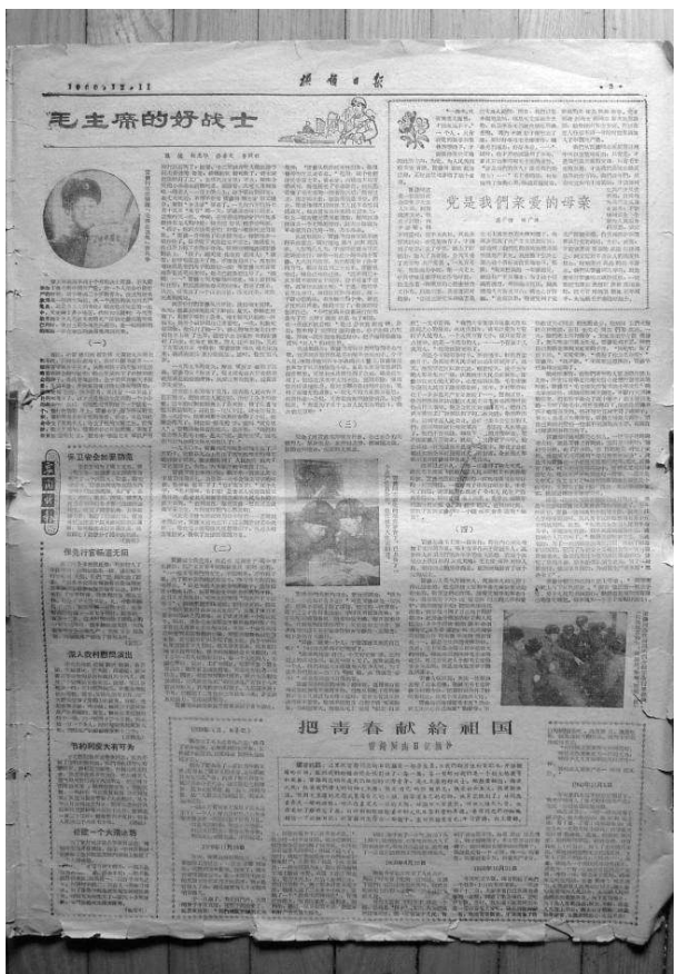
▲《抚顺日报》有关雷锋事迹的报道

当选为人大代表的那年，雷锋才21岁，距离新中国成立刚好12年。在这12年里，雷锋从一名一无所有的孤儿，沐浴着新中国的温暖春风，成长为了一名光荣的人大代表。在出席抚顺市人民代表大会期间，他由衷地感慨：“自己当了家，作了国家的主人，有了说话的权力。”言语之中道不尽对党、对新中国、对新社会的感恩之情。