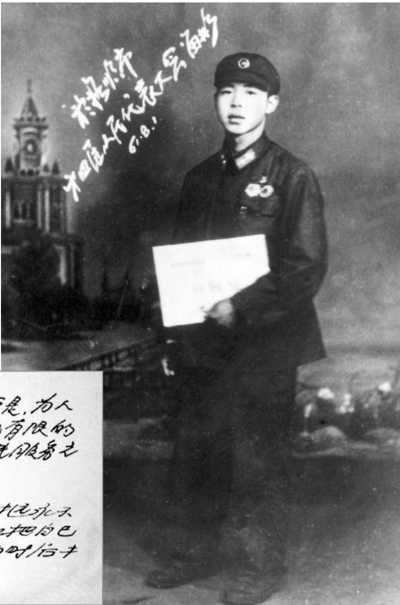
▲1961年8月，雷锋出席抚顺市第四届人大一次会议的纪念照。