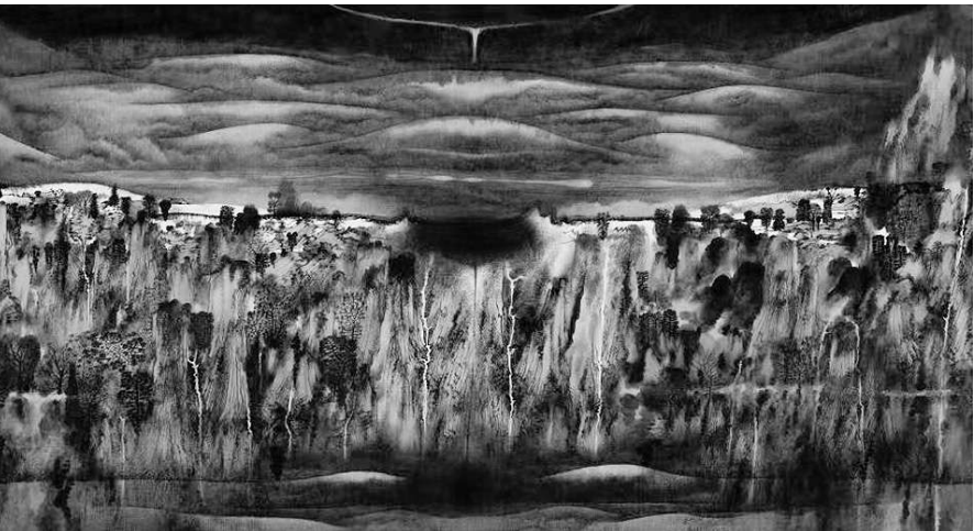
《覆天载地、唯象无形、四方八极、六合九州、天地大同》(局部) 卢高舜 作

二者强调的都是文艺为什么人和怎么为的问题。从我个人几十年的创作经历看，对此体会也是越来越深刻——文艺创作和人民、生活的关系就像鱼和水一样，是天然相连的；二者也是双向反馈与互生互益的关系：一方面，人民需