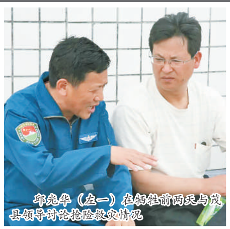
邱光华(左一)在牺牲前两天与茂县领导讨论抢险救灾情况