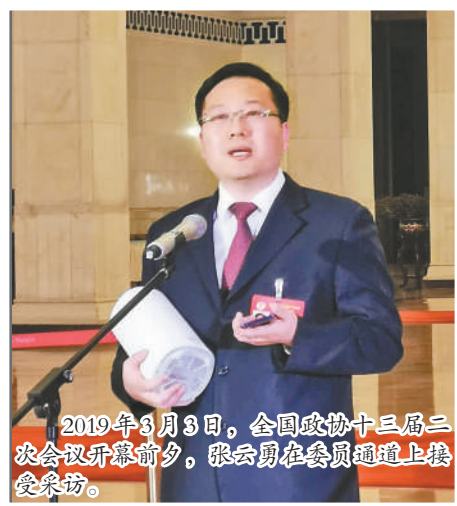
2019年3月9日,全国政协十三届二次会议开幕前夕,张云勇在委员通道上接受采访。