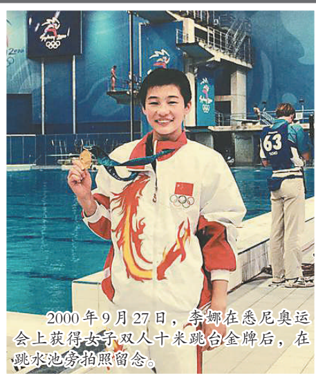
2000年9月27日,李娜在悉尼奥运会上获得女子双人十米跳台金牌后,在跳水池旁拍照留念。