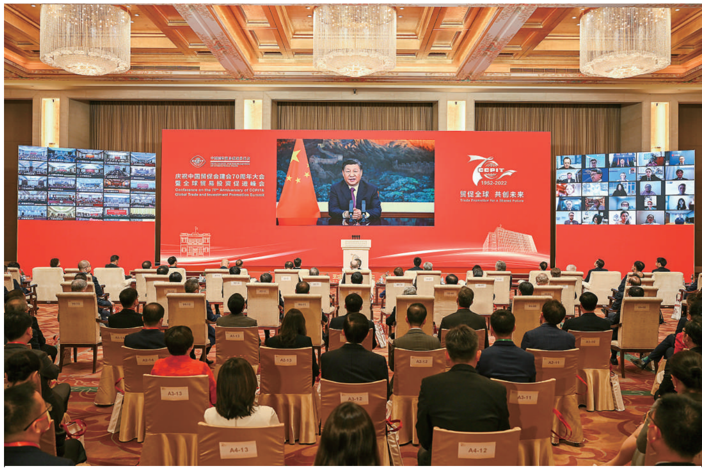
5月18日，国家主席习近平在庆祝中国国际贸易促进委员会建会70周年大会暨全球贸易投资促进峰会上发表视频致辞。

新华社北京5月18日电 5月18日，国家主席习近平在庆祝中国国际贸易促进委员会建会70周年大会暨全球贸易投资促进峰会上发表视频致辞。 习近平指出，中国贸促会1952年成立以来，立足中国、面向世界，为拉紧中外企业利益纽带、推动国际经贸往来、促进国家关系发展，发挥了重要作用。中国贸促会70年的历程，是中国不断扩大对外开放的重要体现，也是各国企业共享发展机遇、实现互利共赢的重要见证。 习近平强调，当前，百年变局和世纪疫情交织，经济全球化遭遇逆流，世界进入新的动荡变革期。各国工商界对和