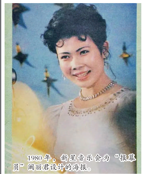
1980年,新星音乐会为“报幕员”闾丽君设计的海报。