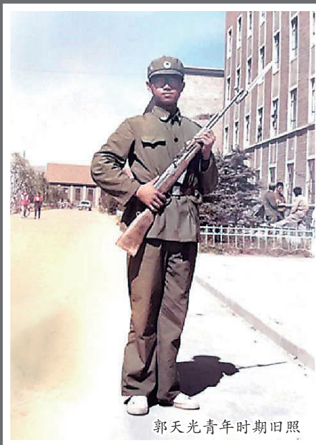
郭天光青年时期旧照