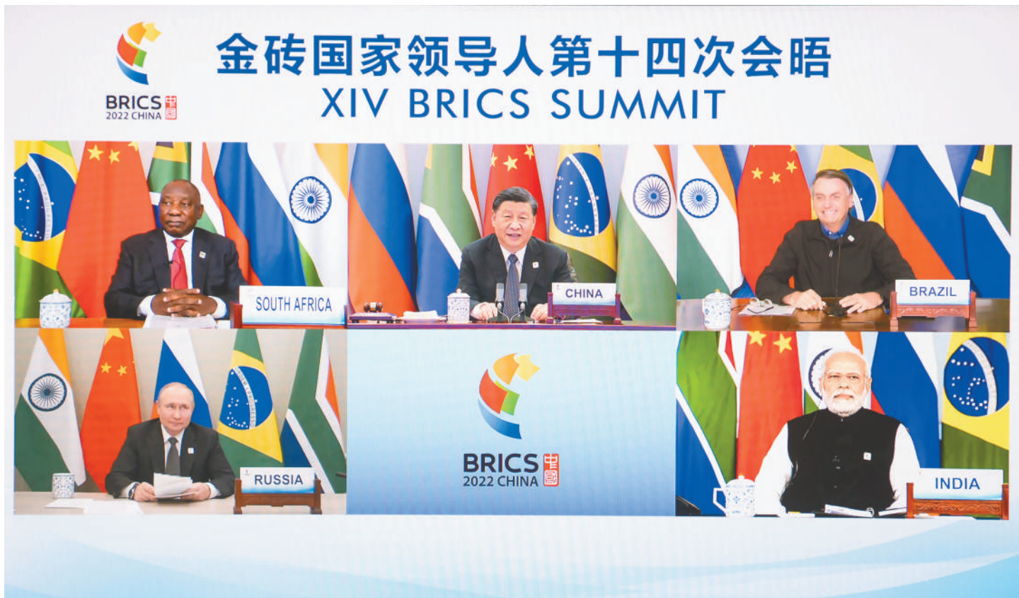
6月23日晚,国家主席习近平在北京以视频方式主持金砖国家领导人第十四次会晤并发表题为《构建高质量伙伴关系 开启金砖合作新征程》的重要讲话。南非总统拉马福萨、巴西总统博索纳罗、俄罗斯总统普京、印度总理莫迪出席。