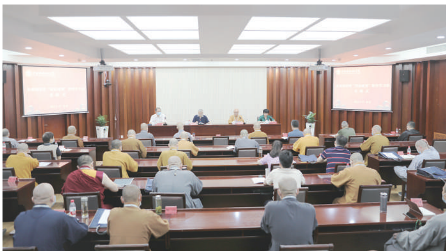
图为首都佛教界“崇俭戒奢”主题教育学习班举行开班式

演觉会长在讲话中强调，勤俭节约是中华民族的传统美德，少欲知足是佛教倡导的重要理念，是佛教徒修行成佛的必要条件。他指出，一段时间以来，受社会上拜金主义、享乐主义和奢靡之风的不良影响，佛教领域也滋生了贪大求奢、借教敛财、铺张浪费等不良风气，严重败坏佛教教风、侵蚀佛教健康肌体、破坏佛教社会形象、妨碍佛教中国化深入推进，乃至对社会风气造成负面影响。本次“崇俭戒奢”主题教育学习班，对于解决影响佛教健康传承突出