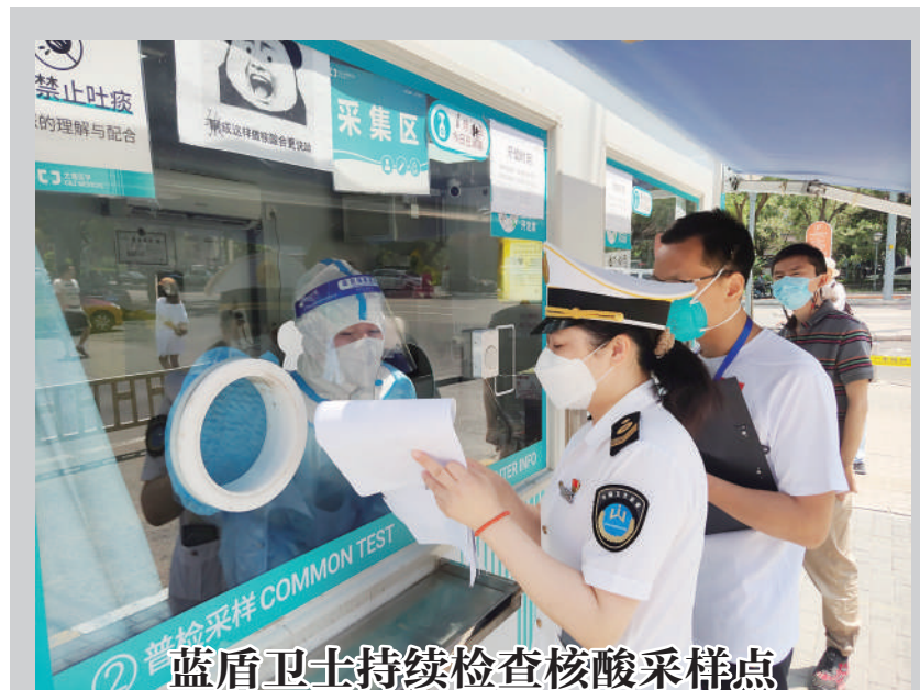
核酸检测是发现传染源最有效手段。日前,海淀区卫生健康监督所的执法人员持续开展辖区核酸采样点监督检查。检查人员重点对核酸采样点的扫码测温、培训情况、采样流程、样本保存及转运、清洁消毒等工作进行了监督检查。

“‘大于法务’平台支持拍摄取证、权威认证,提供合同模板、公证预约、‘一对一’律师咨询等服务,同时还推出普法剧场和课堂,用公众喜闻乐见的形式普及宣传法律知识。”天津市公证法律战略合作联盟相关负责人表示,“大于法务”平台希望能为群众打通法律服务供给“最后一公里”。