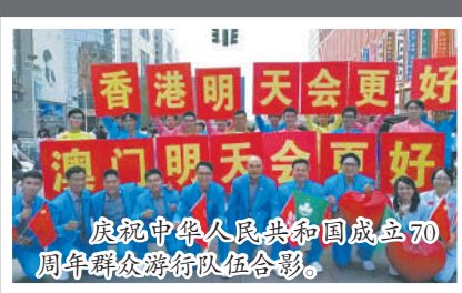
庆祝中华人民共和国成立70周年群众游行队伍合影。