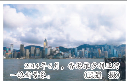
2014年6月,香港维多利亚湾一浪新景象。