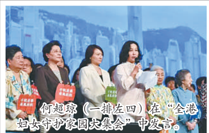
何超琼(一排左四)在“全港妇女守护家园大集会”中发言。