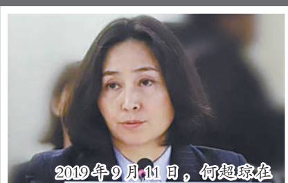
2019年9月11日,何超琼在联合国经社理事会上发言。