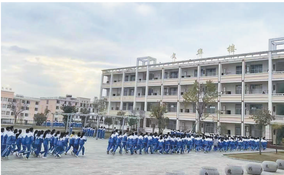
乡村振兴必先振兴乡村教育。县中,承载着乡村孩子未来的梦想。办好县中,对稳定县域内生源和师资、促进义务教育优质均衡发展具有重要作用。

“学生没有分数就过不了今天的高考,但只有分数恐怕也赢不了未来的大考;学校没有升学率就没有高考竞争力,但教育只关