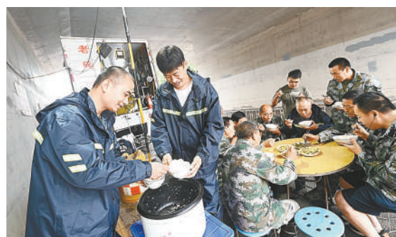
▲应急救援时间紧、任务重，队员们的一日三餐只能抽空解决。