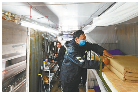
▲如遇汛期，队员们吃住和装备都在这辆改装的“应急车”上，他们依旧保留着部队的生活习惯。