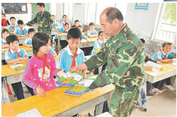
▲“老兵应急服务队”队员为灾区的孩子捐赠学习用品。