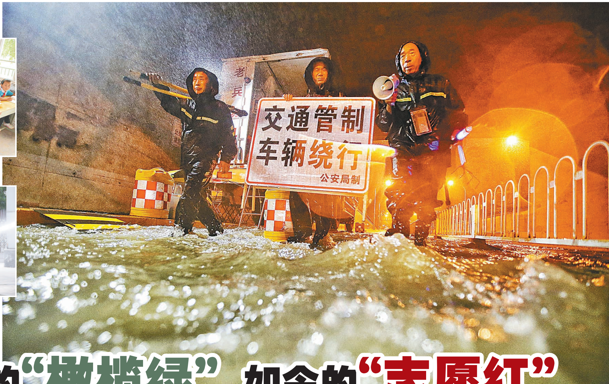
▲队员们协助交警进行交通疏导，防止车辆误入积水的桥下。