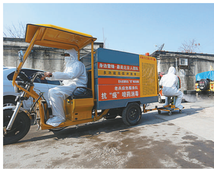
▲“老兵应急服务队”积极参与社区疫情防控。