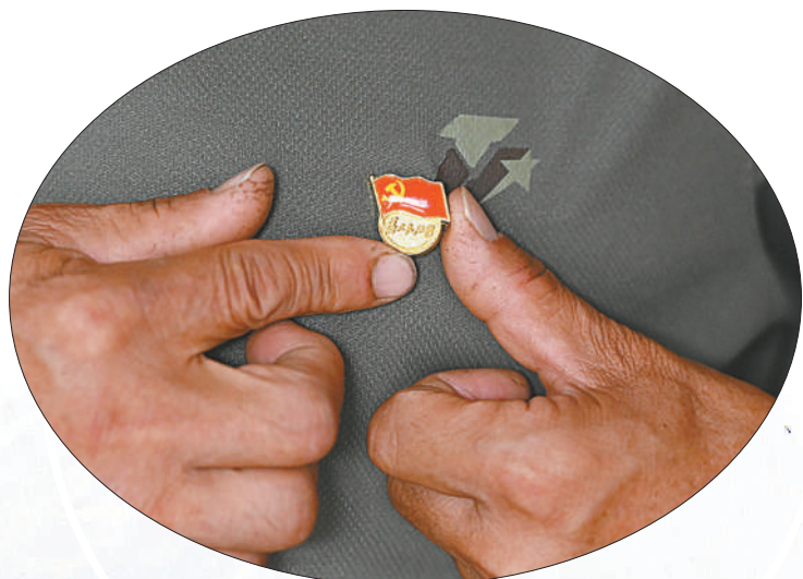
▲队员们依旧保持着佩戴党徽的习惯。

24小时轮流蹲守在防汛点位，带头奋战在疫情防控一线，常年坚持为社区的孤寡老人义务疏通下水道……这支由25名退伍老兵组成的“老兵应急服务队”，他们忙碌的身影闪烁在京城的大街小巷，总是在第一时间出现在群众最需要的地方。