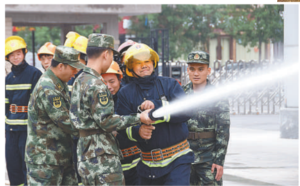
▲消防队员对老兵应急服务队进行消防救援培训。