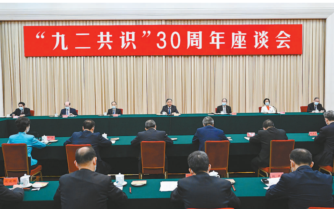
7月26日,“九二共识”30周年座谈会在北京人民大会堂举行。中共中央政治局常委、全国政协主席汪洋出席并讲话。

本报讯(记者 修菁)“九二共识”30周年座谈会7月26日在人民大会堂举行。中共中央政治局常委、全国政协主席汪洋出席并讲话。他强调,推动两岸关系和平发展、推进祖国和平统一进程,是全体中华儿女的共同愿望,是中国共产党解决台湾问题的基本主张。要坚持以习近平新时代中国特色社会主义思想为指导,贯彻落实新时代党解决台湾问题的总体方略,广泛团结海内外中华儿女,坚持一个中国原则和“九二共识”,共创祖国统一的历史伟业,共享民族复兴的伟大荣光。