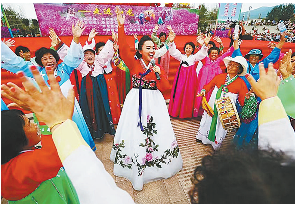
▲卞英花参加“中华民族一家亲”文化下基层演出活动

今年是中央民族歌舞团建团70周年,也是吉林省延边朝鲜族自治州成立70周年。作为我国著名朝鲜族青年歌唱家和中央民族歌舞团歌唱演员,卞英花一直致力于用歌声弘扬时代主旋律,促进民族文化交流,她演唱的《红太阳照边疆》《延边人民热爱毛主席》《党的光辉照延边》等歌曲传遍四方。8月6日晚,“《红太阳照边疆》卞英花独唱音乐会”将在北京民族剧院举办,本次音乐会也是中央民族歌舞团“多彩的旋律”系列音乐会之一。人民政协报记者专访卞英花,讲述她的从艺故事和艺术感悟。