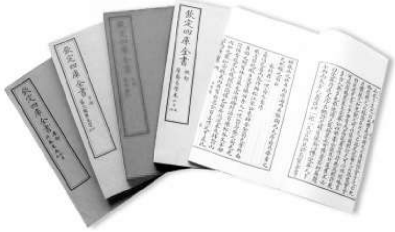
以文渊阁本《四库全书》为底本的原大影印《四库全书》

近日，针对不同的阅读需求，全国古籍整理出版规划领导小组办公室向读者相继推荐了《论语》《史记》的多个优秀整理版本。古籍是中华文明的瑰宝，是中华民族的精神财富，习近平总书记指出，要“深入挖掘古籍蕴含的哲学思想、人文精神、价值理念、道德规范，推动中华优秀传统文化创造性转化、创新性发展”。古籍版本研究对于古籍阐释、赓续文脉，以及读书治学等都具有重要意义。本报记者采访委员、学者，探讨阐释古籍版本与古籍传承发展。