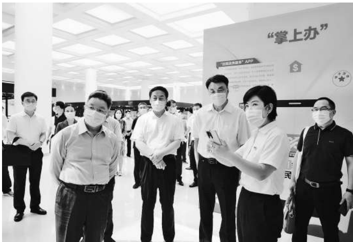
考察团在沈阳市行政服务中心考察。