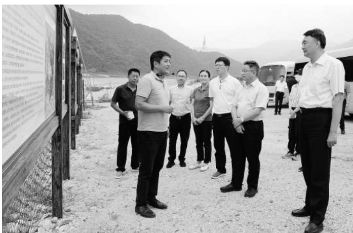
考察团一行在本溪考察台商台企参与当地乡村振兴情况。