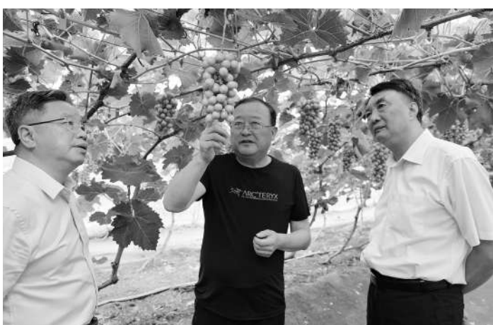
考察团一行在本溪考察台商台企参与当地乡村振兴情况。