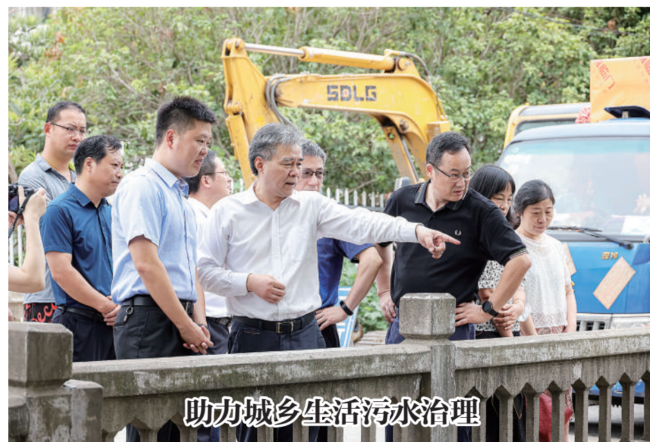
助力城乡生活污水治理

主席会议成员一致认为,应进一步增强服务主动性,及时掌握企业信息,着力推进数字经济高质量发展,真正实现“云”在这里,“雨”也落在这里。