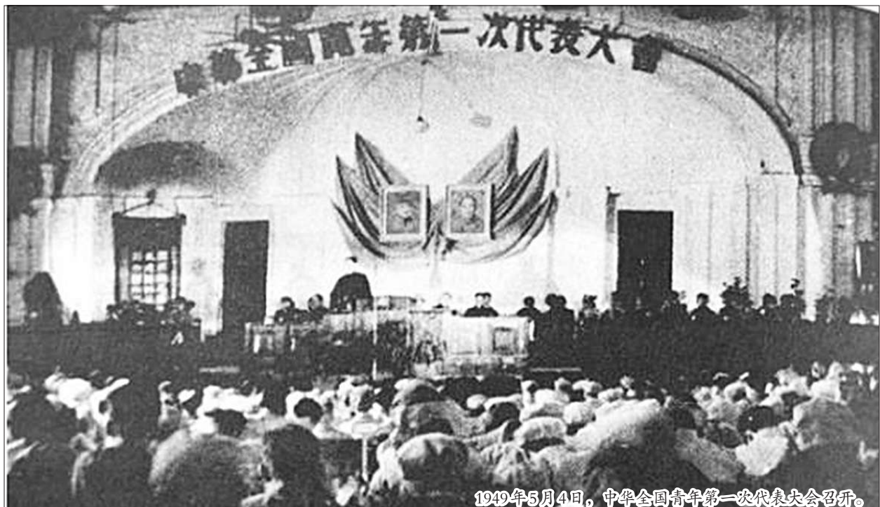
1949年5月4日,中华全国青年第一次代表大会召开。

在党的七大筹备期间,中央认为,目前中国青年运动的性质,应该是全民族的、非党的、民主团结的、最广泛的、新式青年运动,提出建立青年联合会。1945年4月6日,中共中央发出《中央关于准备成立解放区青年联合会的指示》。5月3日,中国解放区青年联合会筹备委员会召开成立大会。5月4日,《解放日报》发表社论,号召解放区青年努力迎接新的战斗和新的青年组