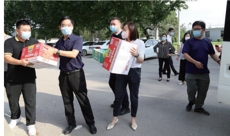
日前，山东省聊城市茌平区突发新冠肺炎疫情，区政协委员积极行动起来，或投身抗疫一线，或积极捐款捐物，助力抗疫。连日来，茌平区崔河祥委员工作室积极筹备物资，相继到基层捐赠物资。

相关负责人介绍，目前正在积极推进新家园、唐家山等17个老旧小区(单位)的雨污分流改造项目，逐步实现污水管网全覆盖，生活污水全收集、全处理。 “区政协将进一步强化措施，坚持力度不减、标准提档，以更高标准、更实举措，助力生态环境整治工作向纵深开展，推动生态文明建设工作再掀高潮。”谢家集区政协相关负责人表示。(王淑雯)