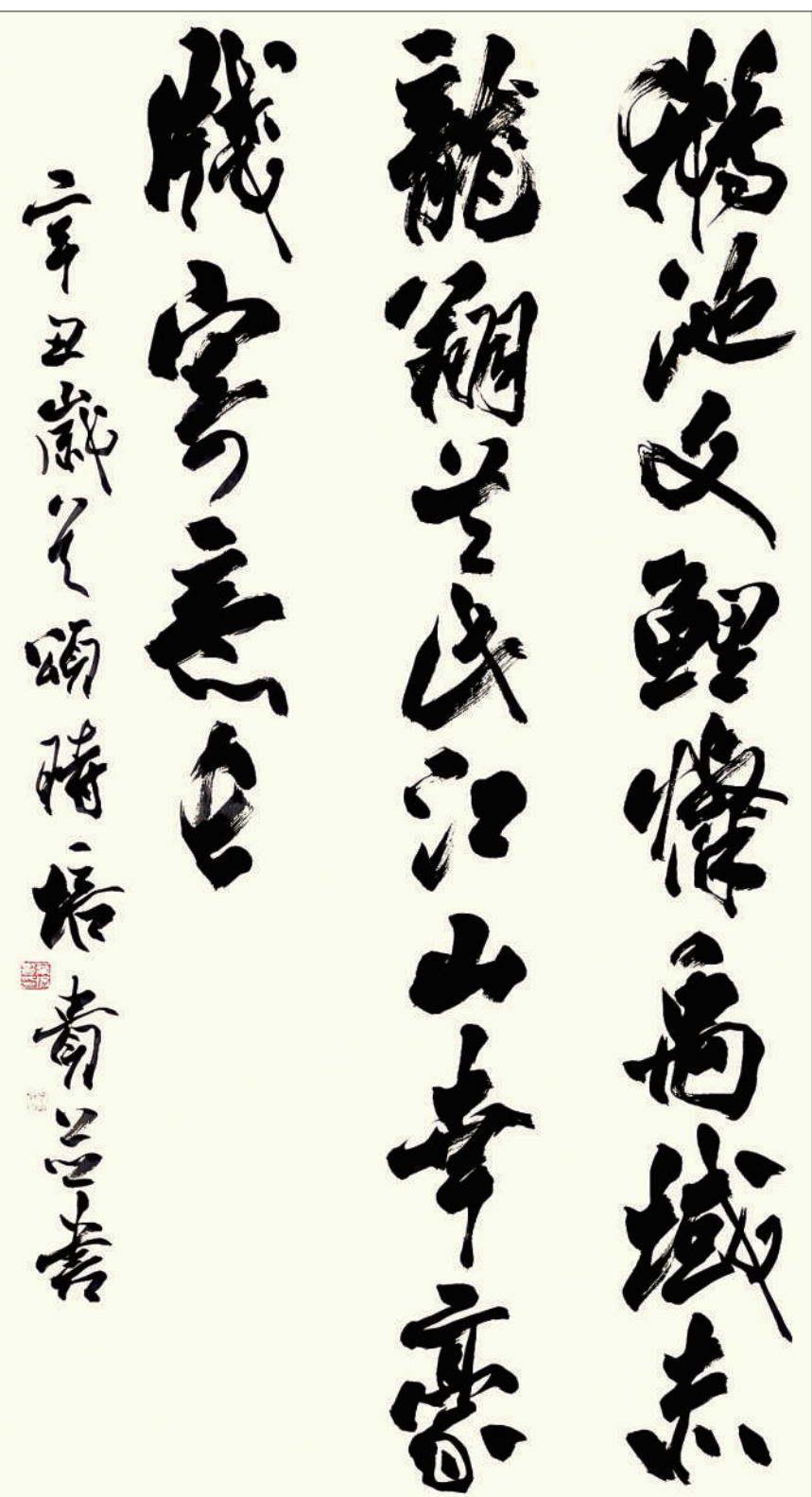
鹅池文鲤情禹域未 自作诗颂时 2021年