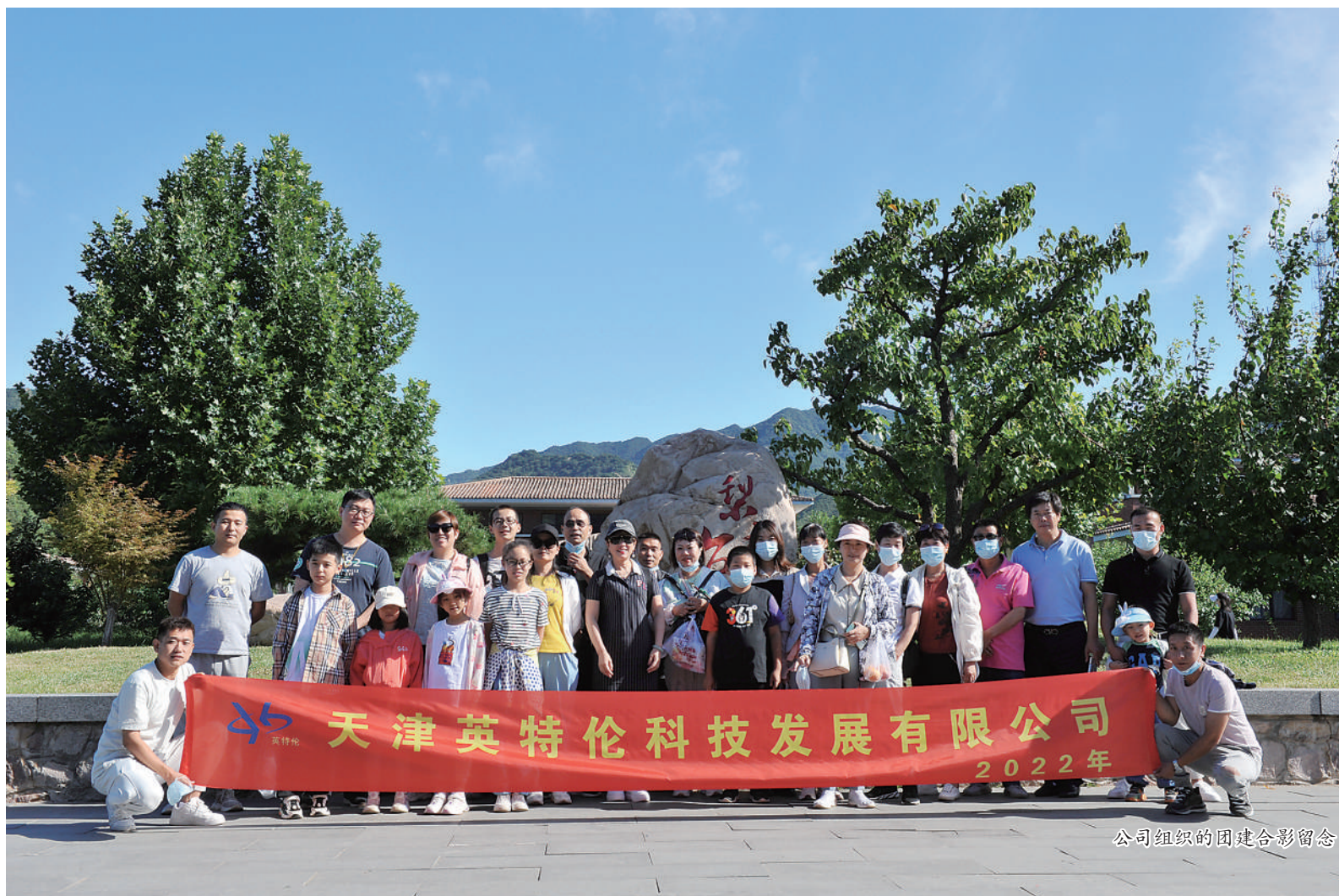
公司组织的团建合影留念

年成立以来，经过了14年的创新发展和攻坚克难，凭借一流的产品质量，强大的研发、生产、售后服务，成为国内多家知名钢铁企业的主要合格供应商，同时为客户解决国产化替代降低成本、提高企业利润率提供可靠支撑。