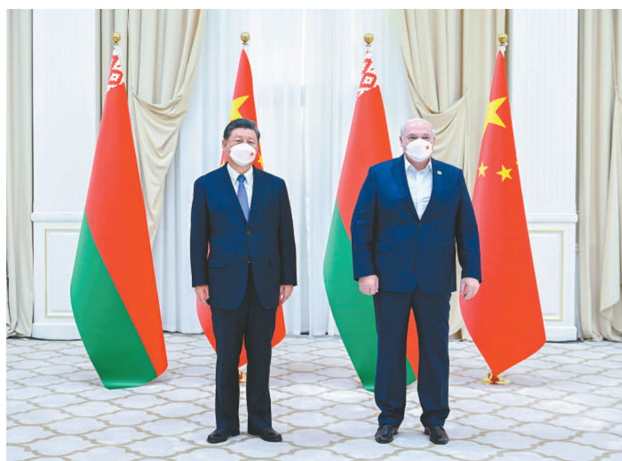
▲当地时间9月15日下午，国家主席习近平在撒马尔罕国宾馆会见白俄罗斯总统卢卡申科。

新华社乌兹别克斯坦撒马尔罕9月15日电(记者 刘华 蔡国栋)当地时间15日下午，国家主席习近平在撒马尔罕国宾馆会见白俄罗斯总统卢卡申科。两国元首决定，将双边关系定位为全天候全面战略伙伴关系。习近平指出，中白建交30年来，两国关系不断提质升级，全方位合作扎实推进。中白关系定位为全天候全面战略伙伴关系，实现了中白关系的历史性跨越。中方愿同白方一道，加大相互政治支持，释放各领域合作潜力，推动中白关系得到更大发