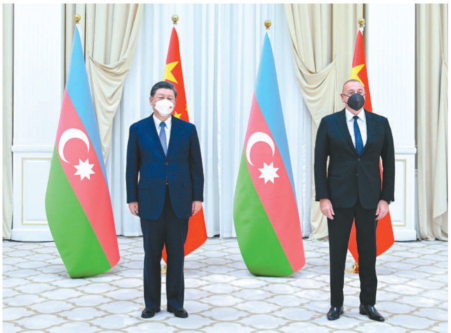
▲当地时间9月15日下午，国家主席习近平在撒马尔罕国宾馆会见阿塞拜疆总统阿利耶夫。