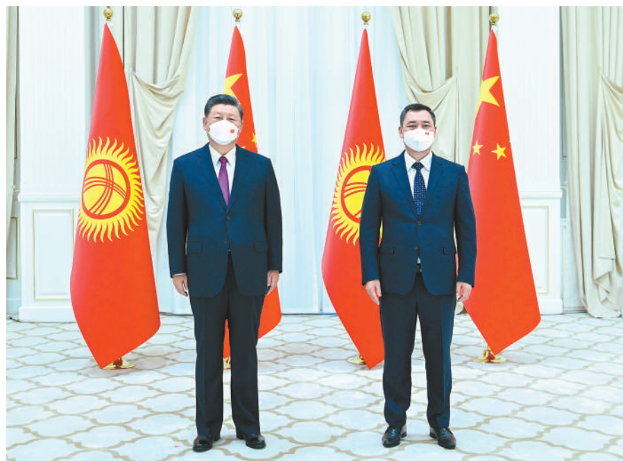
▲当地时间9月15日上午，国家主席习近平在撒马尔罕国宾馆会见吉尔吉斯斯坦总统扎帕罗夫。

新华社乌兹别克斯坦撒马尔罕9月15日电(记者 孙浩 蔡国栋)当地时间15日上午，国家主席习近平在撒马尔罕国宾馆会见吉尔吉斯斯坦总统扎帕罗夫。习近平指出，今年2月，我们在北京进行了友好、深入、务实的交流，达成许多重要共识。中方坚定支持吉尔吉斯斯坦自主选择的发展道路，支持吉方维护国家独立、主权、安全，反对任何外部势力以任何借口干涉吉方内政。中国过去、现在、将来都是吉尔吉斯斯坦可以信赖和倚重的朋友和伙伴。