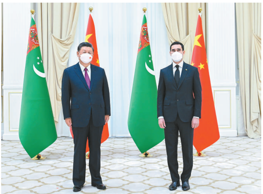
▲当地时间9月15日上午，国家主席习近平在撒马尔罕国宾馆会见土库曼斯坦总统谢尔达尔·别尔德穆哈梅多夫。

新华社乌兹别克斯坦撒马尔罕9月15日电(记者 刘华 刘悦)当地时间15日上午，国家主席习近平在撒马尔罕国宾馆会见土库曼斯坦总统谢尔达尔·别尔德穆哈梅多夫。习近平指出，中土建交30年来，两国关系持续健康稳定发展，战略合作关系达到高水平。中方始终从战略高度和长远角度看待中土关系，尊重土方自主选择符合本国国情的发展道路，反对任何外部势力干涉土库曼斯坦内政和稳定发