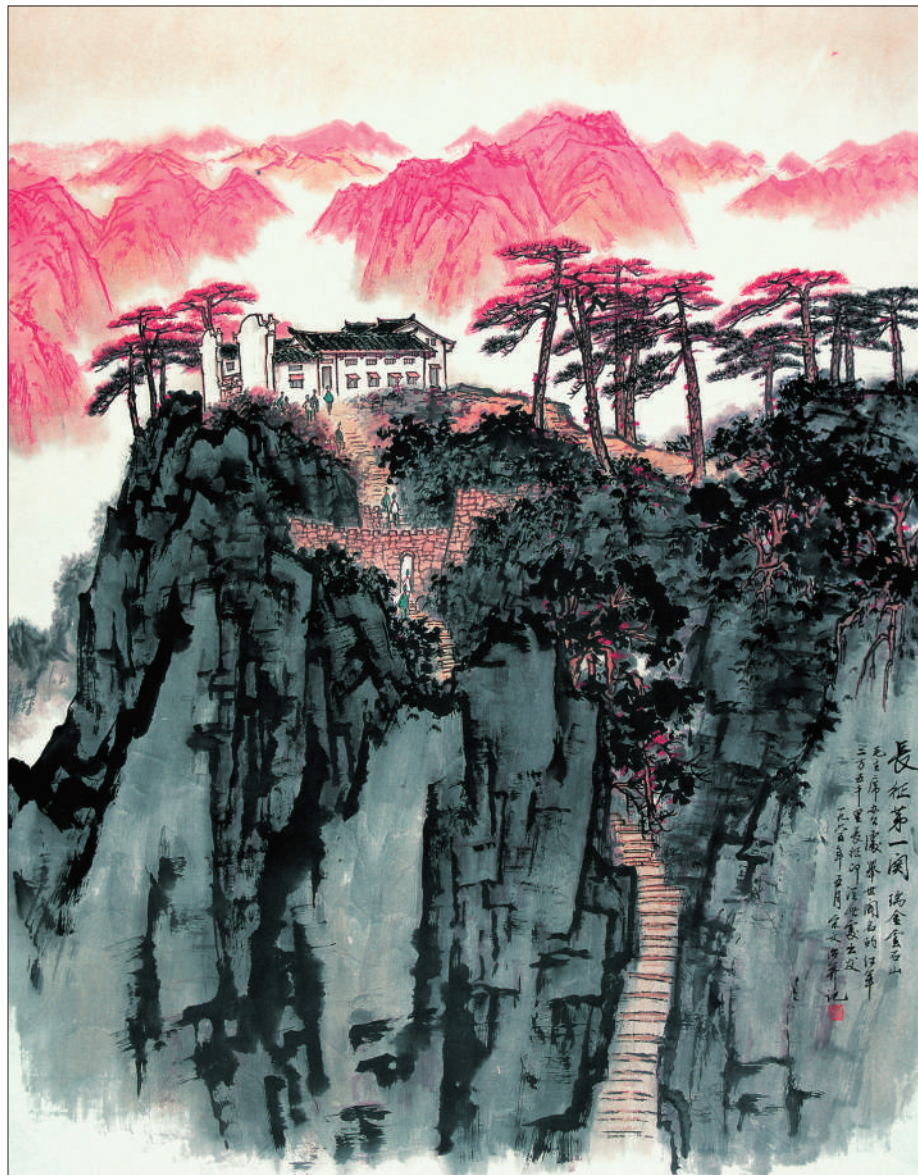
长征第一关(中国画)