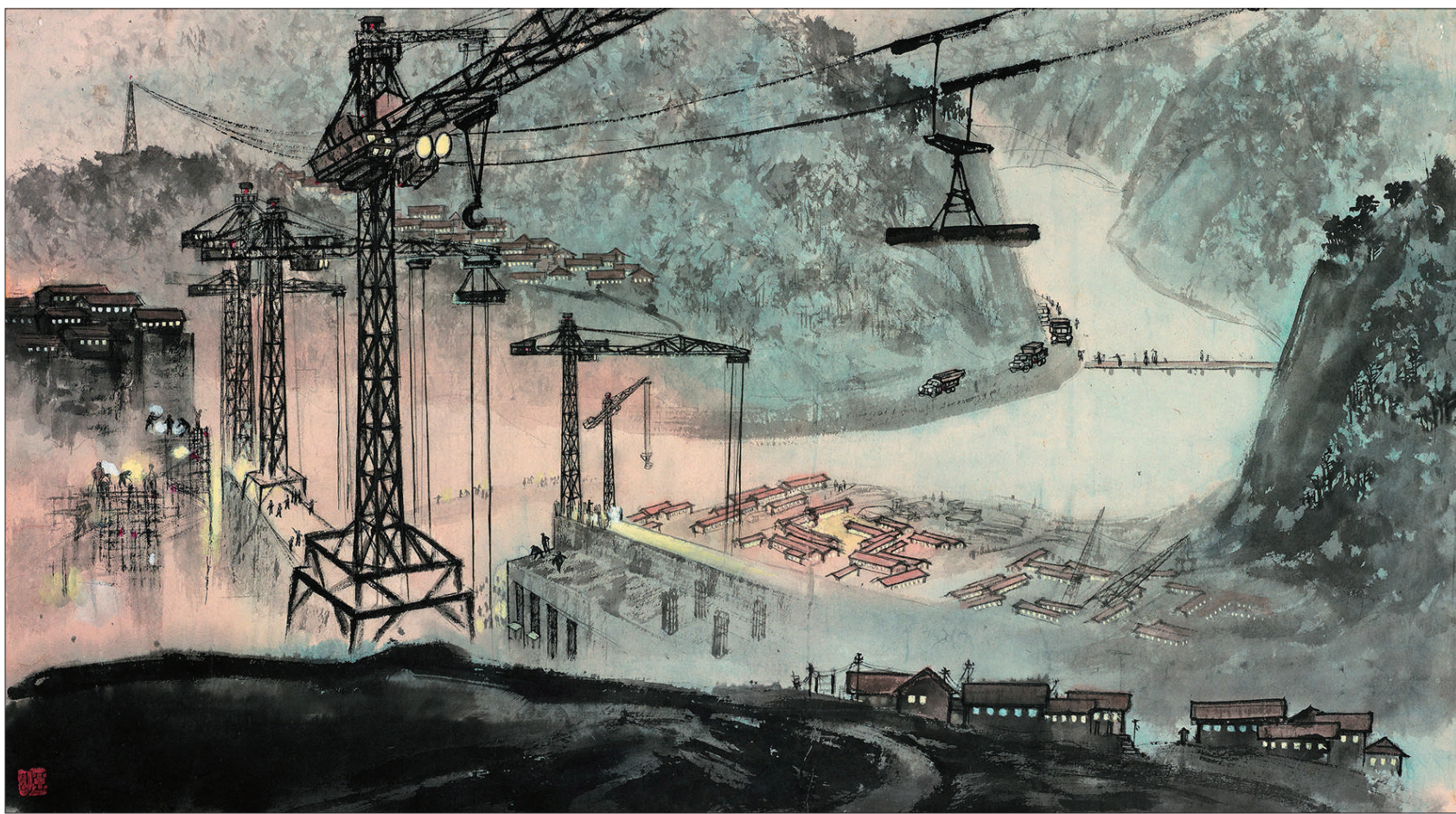
水力发电站工地(中国画)