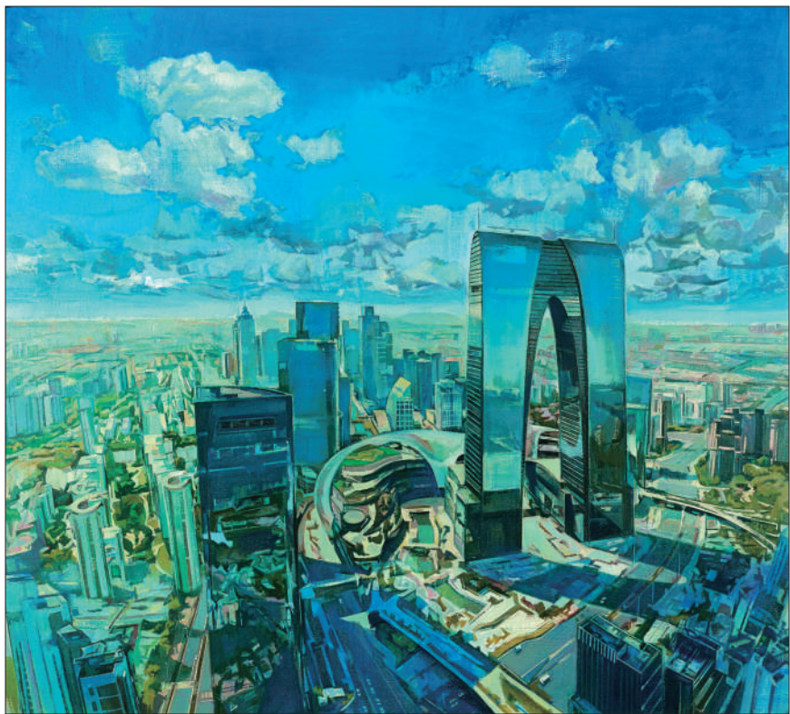
苏州工业园区(油画)