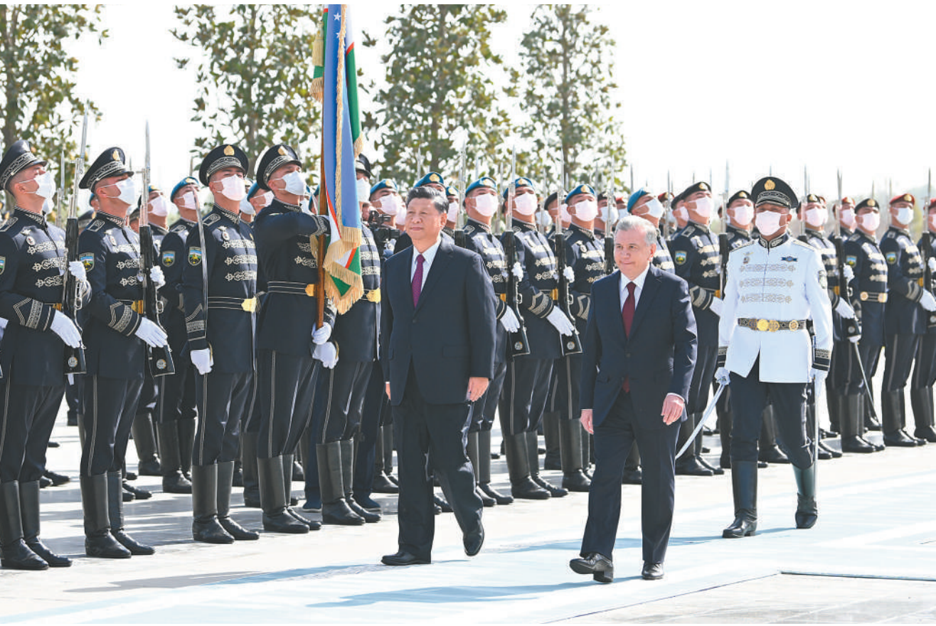
当地时间9月15日，国家主席习近平在撒马尔罕同乌兹别克斯坦总统米尔济约耶夫会谈。会谈前，米尔济约耶夫为习近平举行隆重欢迎仪式。