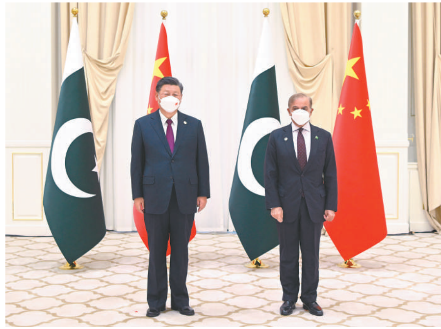
▲当地时间9月16日上午，国家主席习近平在撒马尔罕国宾馆会见巴基斯坦总理夏巴兹。