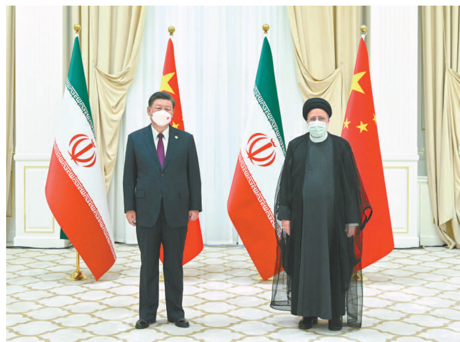
▲当地时间9月16日上午，国家主席习近平在撒马尔罕国宾馆会见伊朗总统莱希。