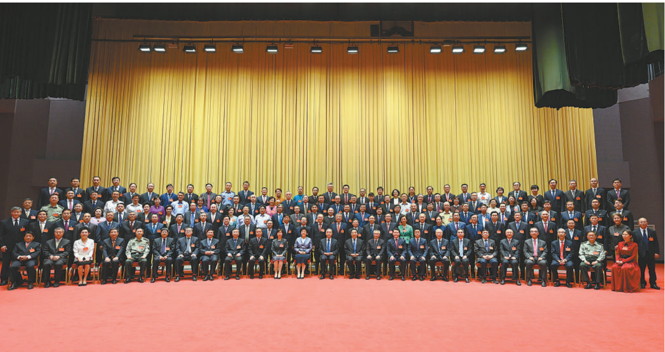
9月20日，中共中央政治局常委、全国政协主席汪洋在北京会见政协第十三届全国委员会优秀提案和先进承办单位获奖代表并讲话。

汪洋指出，提案工作是人民政协一项基础性工作，是人民政协履职尽责的重要方式。十三届全国政协以来，全国政协会同有关方面认真贯彻落实习近平总书记关于加强和改进人民政协工作的重要思想，将提质增效