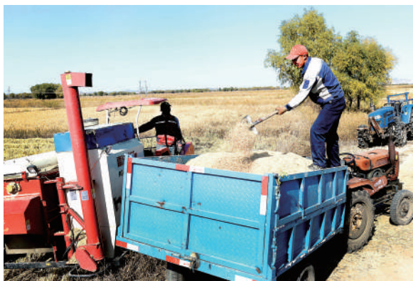
近日,内蒙古自治区兴安盟科右中旗杜尔基镇双金嘎查万亩稻田喜迎丰收。