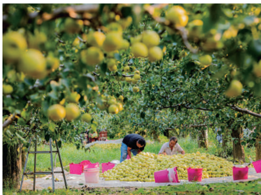
河南省商丘市宁陵县石桥镇万亩梨园内,一派喜人的丰收景象。徐硕 摄