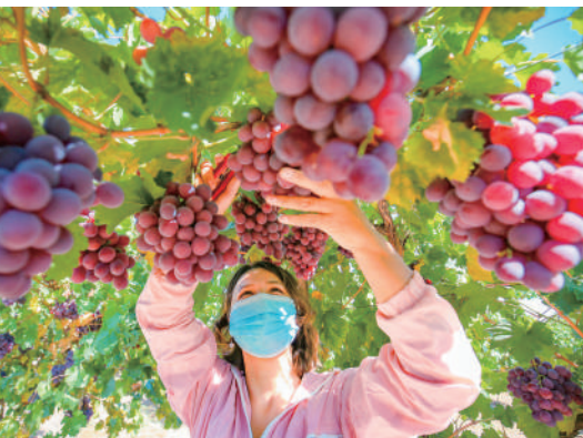
在新疆昌吉回族自治州呼图壁县五工台镇唐墩果园葡萄种植农民专业合作社,农民在田间采摘葡萄。