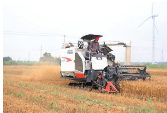
山东省德州市庆云县三十二万亩小麦迎来丰收季。