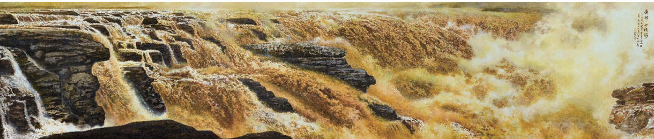
《黄河·母亲河》1800cm x 372cm 2013年

王西京说，用水墨艺术的当代语言描绘历史人物，不仅是对伟大历史瞬间的描摹与再现——革命圣地延安见证