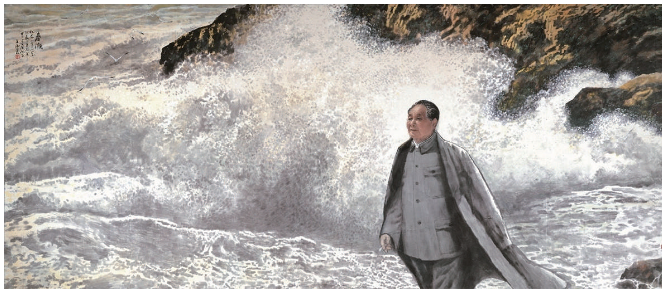
《延安记忆》240cm x 200cm 2021年