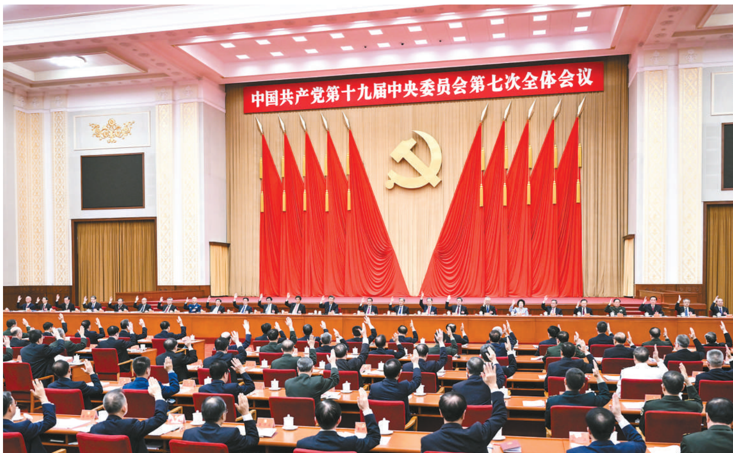
中国共产党第十九届中央委员会第七次全体会议,于2022年10月9日至12日在北京举行。中央政治局主持会议。