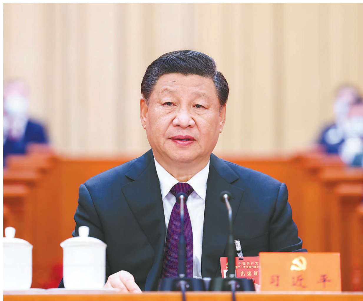
10月22日,中国共产党第二十次全国代表大会在北京人民大会堂胜利闭幕。习近平同志主持大会。

习近平强调,中国共产党走过了百年奋斗历程,又踏上了新的赶考之路。一百年来,党团结带领全国各族人民取得了新民主主义革命、社会主义革命和建设、改革开放和社会主义现代化建设的伟大胜利,开创了中国特色社会主义新时代。百年成就无比辉煌,百年大党风华正茂。我们完全有信心有能力在新时代新征程创造令世人刮目相看的新的更大奇迹。全党要紧密团结在党中央周围,高举中国特色社会主义伟大旗帜,坚定历史自信,增强历史主动,敢于斗争、敢于胜利,埋头苦干、锐意进取,团结带领全国各族人民为实现党的二十大确定的目标任务而奋斗