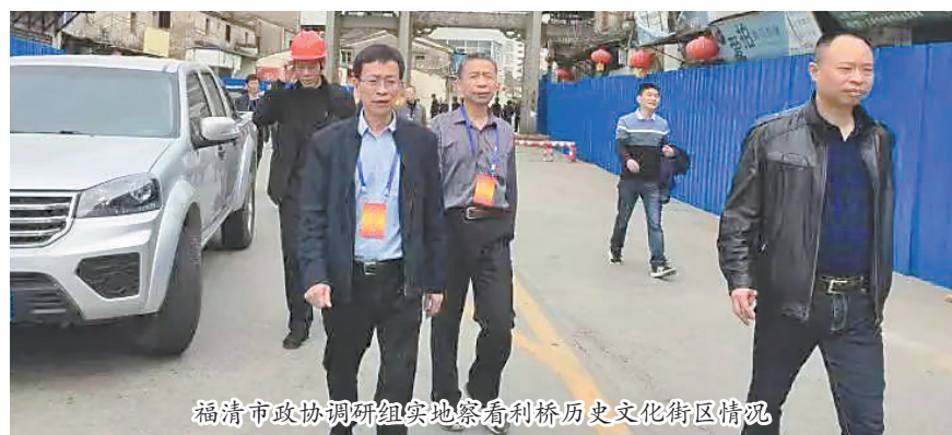
福清市政协调研组实地考察利桥历史文化街区情况

的海内外民族文化,瑞云塔点灯和龙首桥过桥取吉利等风土民俗,叶向高、刘克庄等历史人物事迹与民间掌故传说,均集于此地,可谓荟萃古今、融合中西。“怎么办?道路不建,交通、消防等现实问题不能解决;道路若建,文物、文脉则难免受损。”彼时,参与其中的市政协委员们与该项目工作者、群众代表和城建部门负责人多次就有关问题进行交流,但双方各执一词,意见分歧,争执不下,难以达成一致。