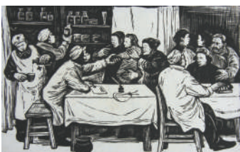
卫生合作社(版画) 彦涵 作