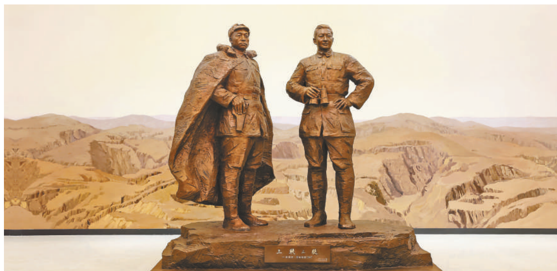
三战三捷——彭德怀、叶仲勋在1947(雕塑)