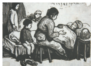
群众看护伤员(版画) 古元 作