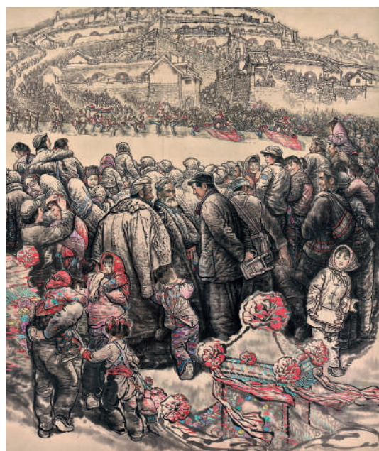
解放区的天(国画) 刘文西 作