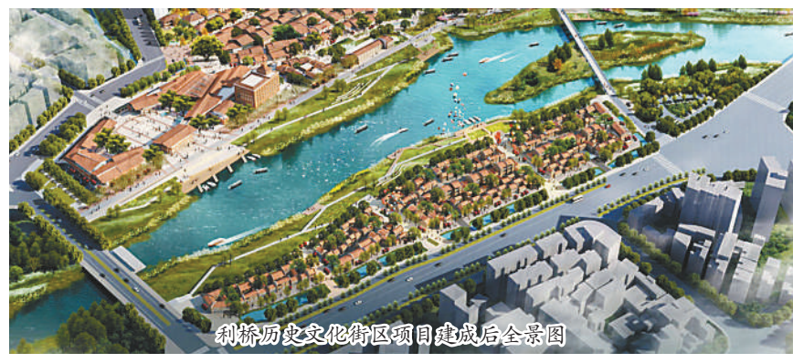
利桥历史文化街区项目建成后全景图

一石击水,波浪迭起。仅用一周时间,市政协调研组就对涉及的2000多户征迁户进行有效问卷调查1848份。同时,结合前期调查结果,市政协第一时间向市委提交了《关于重点项目征迁建设