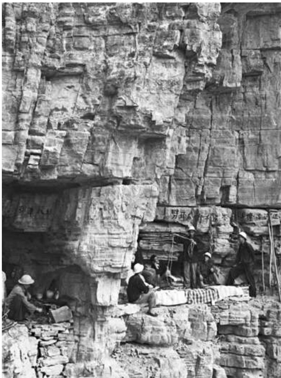
▲住在山崖石缝中的修渠工人

开了一张引、蓄、灌、提相结合的水利网,结束了这里十年九旱、水贵如油的历史,铸就了“自力更生、艰苦创业、团结协作、无私奉献”的红旗渠精神。