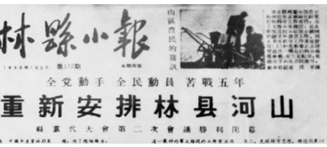
▲林县报纸上关于中共林县二届二次党代会的报道。

数万修渠民工同时开工,住房、材料、工具、运输……都需要解决,每天光粮食、蔬菜和取暖用煤就要15万公斤。红旗渠开工之时,党和人民正面临着新中国成立以来最严重的经济困难,一时难以拔出力量投入建设。