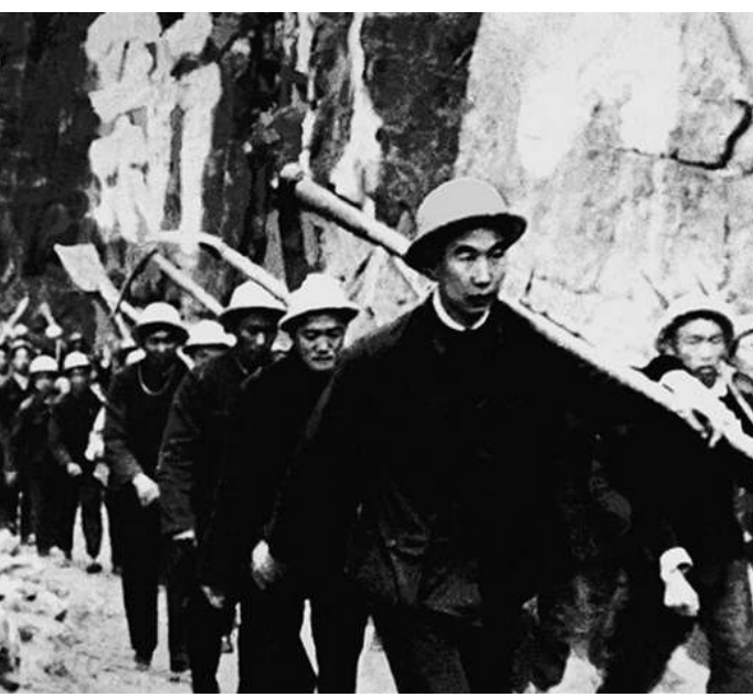
▲林县县委干部带领修渠大军向工地进发。

“自力更生是法宝,众人拾柴火焰高,建渠不能靠国家,全靠双手来创造。”林县县委把工地指挥部设在了施工前线盘阳村,干部与民工实行“五同”:同吃、同住、同劳动、同学习、同商量解决问题。山高坡陡,建