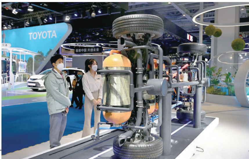
丰田的氢燃料汽车车体展示