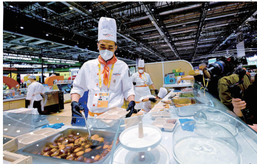
光明食品集团带来了99种各式套餐搭配，为学生带来安全、健康的标准化、多样化餐食。厨师在现场烹饪。