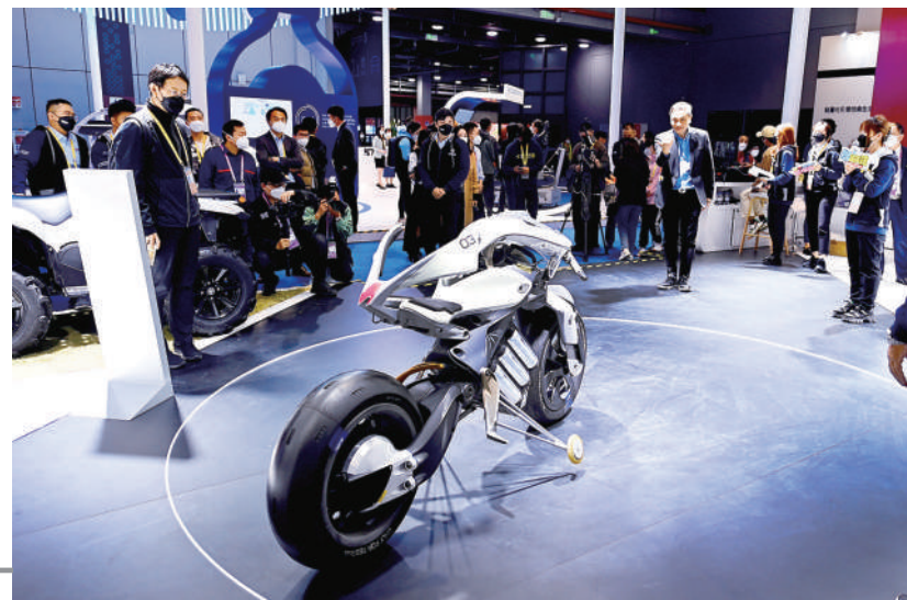
雅马哈展出新品无人驾驶摩托车