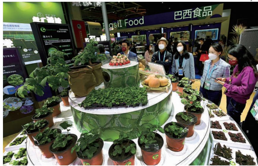
进博会的食品及农产品展区首设了农作物种业专区，涵盖了育种或栽培技术，种子机械，种业创新研发成果，水稻、小麦、瓜果、蔬菜、苗木花卉等农作物种子。