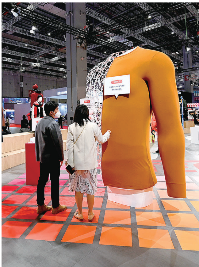
优衣库展台前，2.5米巨型HEATTECH“魔力”保暖内衣全球首展，是更环保的保暖黑科技。