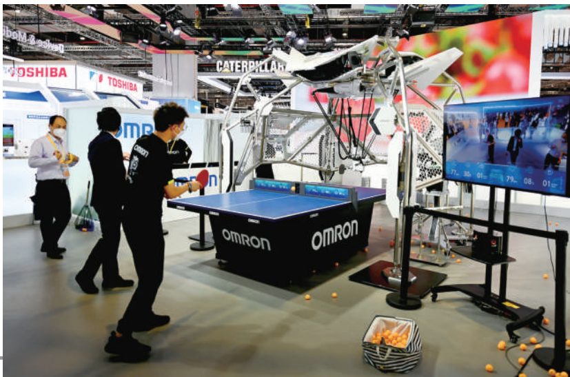
技术装备展区内欧姆龙展台上，工作人员与第七代乒乓球教练机器人进行对打。