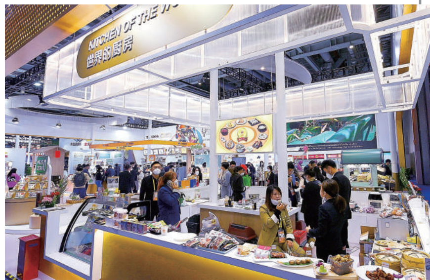
食品及农产品展区的一家集采企业展台，吸引着观众品尝。