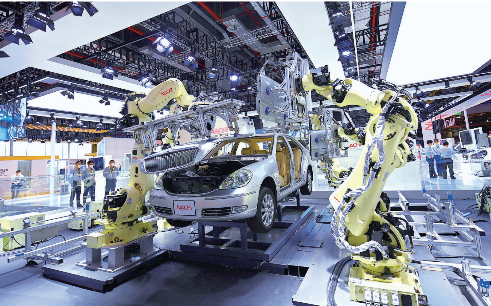
不二越企业的智能机器人，挥动机械手臂，几分钟完成从组装到拆卸的全过程。