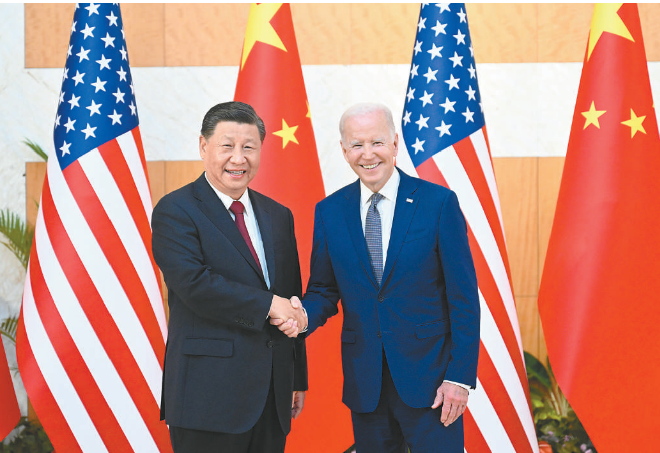
当地时间11月14日下午，国家主席习近平在印度尼西亚巴厘岛同美国总统拜登举行会晤。