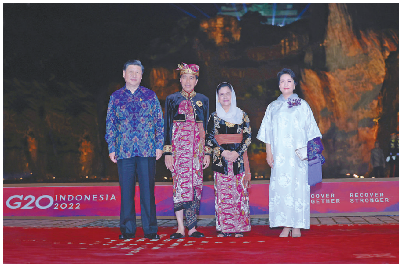
当地时间11月15日晚，国家主席习近平和夫人彭丽媛在印度尼西亚巴厘岛出席二十国集团领导人峰会欢迎晚宴。这是习近平主席夫妇在晚宴前同印度尼西亚总统佐科夫妇合影。