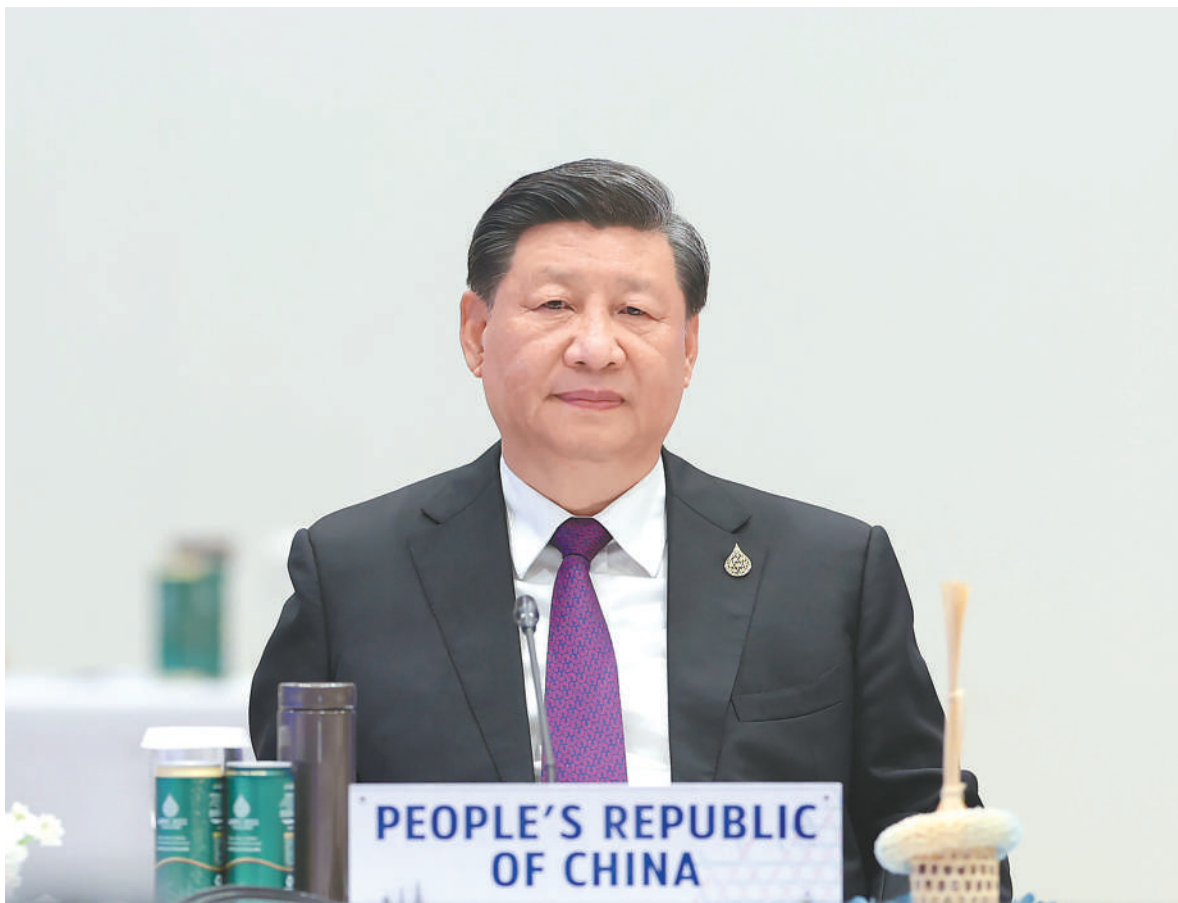
当地时间十一月十八日上午，亚太经合组织第二十九次领导人非正式会议在泰国曼谷国家会议中心举行。国家主席习近平出席会议并发表题为《团结合作勇担责任 构建亚太命运共同体》的重要讲话。(新华社电)

■ 上个月，中国共产党第二十次全国代表大会成功举行，为当前和今后一个时期中国发展指明了方向、规划了蓝图。中国愿同所有国家在相互尊重、平等互利的基础上和平共处、共同发展。中国将坚持实施更大范围、更宽领域、更深层次对外开放，坚持走中国式现代化道路，建设更高水平开放型经济新体制，继续同世界特别是亚太分享中国发展的机遇