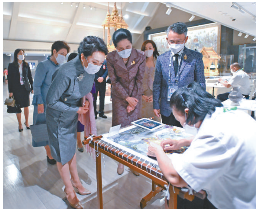
当地时间18日上午，应泰国总理夫人娜拉蓬邀请，国家主席习近平夫人彭丽媛同参加亚太经合组织第二十九次领导人非正式会议的部分经济体领导人及代表的配偶共同参观大城府国家艺术博物馆。这是彭丽媛在娜拉蓬的陪同下参观泰国传统手工艺展示。