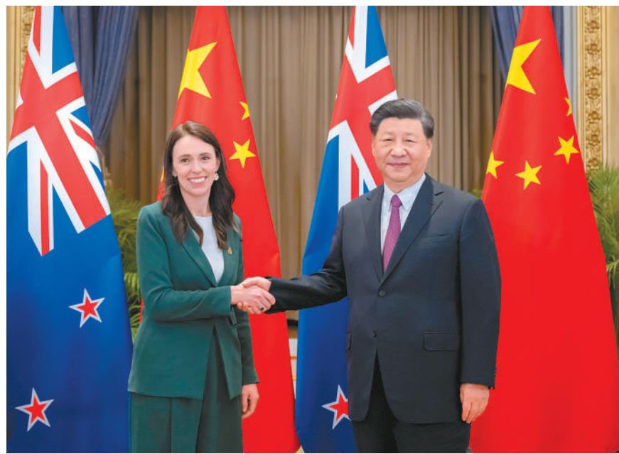
当地时间11月18日下午，国家主席习近平在泰国曼谷会见新西兰总理阿德恩。