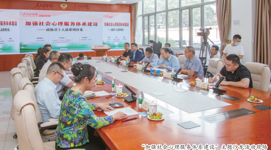
“加强社会心理服务体系”主题沙龙活动现场

为提高平时大众对自身心理健康的重视,好心情集团联合合作伙伴,常年开展义诊活动。联手人民日报健康客户端、健康时报、银川市卫健委、上海人民广播电台长三角之声等,为精神心理等疾病患者提供免费在线咨询问诊等服务。 2020年春节假期,好心情联合人民日报健康客户端、健康时报等多家媒体及企业,共同推出《抗击新冠肺炎护航心理健康》大型义诊活动。自2月7日在线义诊活动开展以后,近一个月时间,义诊日均咨询量超过1.8万次,最高单日咨询量超过3.5万次,完成在线义诊服务37万人次,参与医生超过3000名,服务人群超过15万人。好心情通过此次义诊,帮助有需求的大众及时了解心理问题,为大众筑起心理抗疫防线,得到了业界、媒体及大众的关注和认可。 十年逐梦征程,百舸争流,谱写崭新篇章。站在新的历史起点,好心情集团作为心理医疗和心理健康数字服务平台,一定要认真贯彻落实党的二十大精神,继续发挥自身优势,自信自强、守正创新,踔厉奋发、勇毅前行,不断推动心理服务扎根社区,贴近百姓,服务基层,建设心理科普、测评、诊疗为一体的线上线下结合的新型心理服务模式,力求让人民群众享受到便利化、专业化、标准化的心理健康服务,为增进民生福祉贡献力量,为健康中国建设贡献力量,为以中国式现代化全面推进中华民族伟大复兴贡献力量! (张腾飞) ·广告·