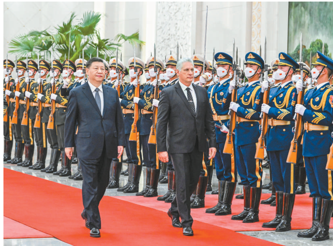
习近平在人民大会堂北大厅为迪亚斯-卡内尔举行欢迎仪式。

赖的好朋友、志同道合的好同志、患难与共的好兄弟。中古传统友谊是老一辈领导人亲手缔结并精心培育的。建交62年来，面对风云变幻的国际形势，中古双方坚定不移深化肝胆相照的友谊，坚定不移开展互利共赢的合作，坚定不移做改革发展的伙伴。中方始终从战略高度看待和发展中古两党两国关系，始终将中古关系摆在外交全局的特殊位置。不论国际形势怎么变，中方坚持中古长期友好的方针不会变，支持古巴走社会主义道路的决心不会变，同古巴一道捍卫国际公平正义、反对霸权强权的意志不会变。新形势下，双方要增进战略协作，在推动构建人类命运共同体的过程中携手共建中古命运共同体。中方将继续坚定支持古巴捍卫国家主权、反对外来干涉和封锁，愿同古巴携手推动落实全球发展倡议、全球安全倡议，共同促进世界和平与发展。当前古巴同志遇到很大挑战。社会主义事业从来都是在奋勇开拓中前进的，我们坚信古巴同志一定能够战胜一切困难，也会尽力提供支持和帮助。中方愿同古巴深化各领域务实合作，落实好共建“一带一路”合作规划，携手推进社会主义现代化建设。 习近平指出，中拉合作本质上是南南合作，以相互尊重为前提，以互利共赢为原则，以开放包容为特质，以共同发展为目标，顺应世界大势和历史潮流，符合地区国家共同利益。(下转2版)