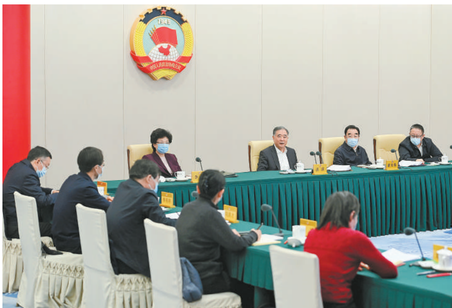
11月25日，十三届全国政协第67次双周协商座谈会在北京召开，全国政协主席汪洋主持会议。

本报(记者 吕巍)十三届全国政协第67次双周协商座谈会25日在京召开，全国政协主席汪洋主持会议。他强调，要学习贯彻习近平总书记关于推动“一带一路”民心相通的重要论述，深刻认识民心相通既是“一带一路”建设的重要内容，又是“一带一路”行稳致远的保障，各领域合作都要赋予增进国家友好、促进民心相通的意义，各方面工作都要坚持以问题为导向，提高针对性精准性实效性，为推动共建“一带一路”高质量发展夯实深厚