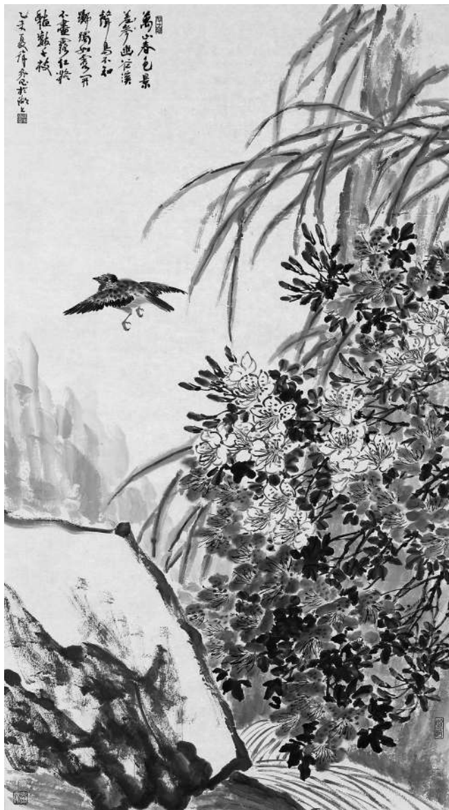
万山春色景参差(国画)