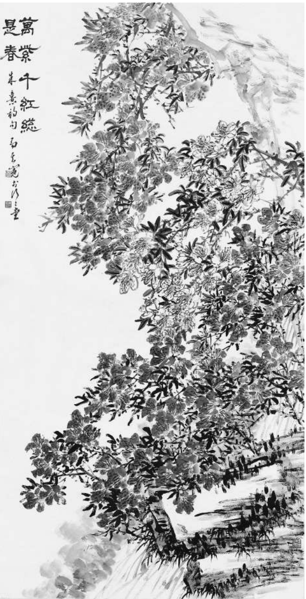
万紫千红总是春(国画)